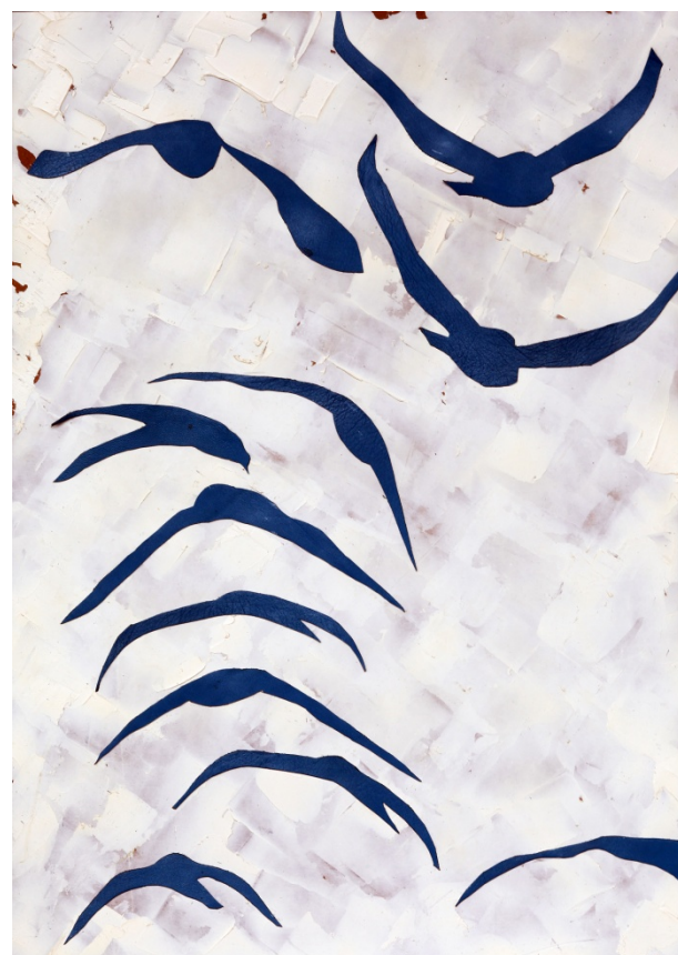
"Voli" - 2009 – Tecnica mista – cm. 80x60