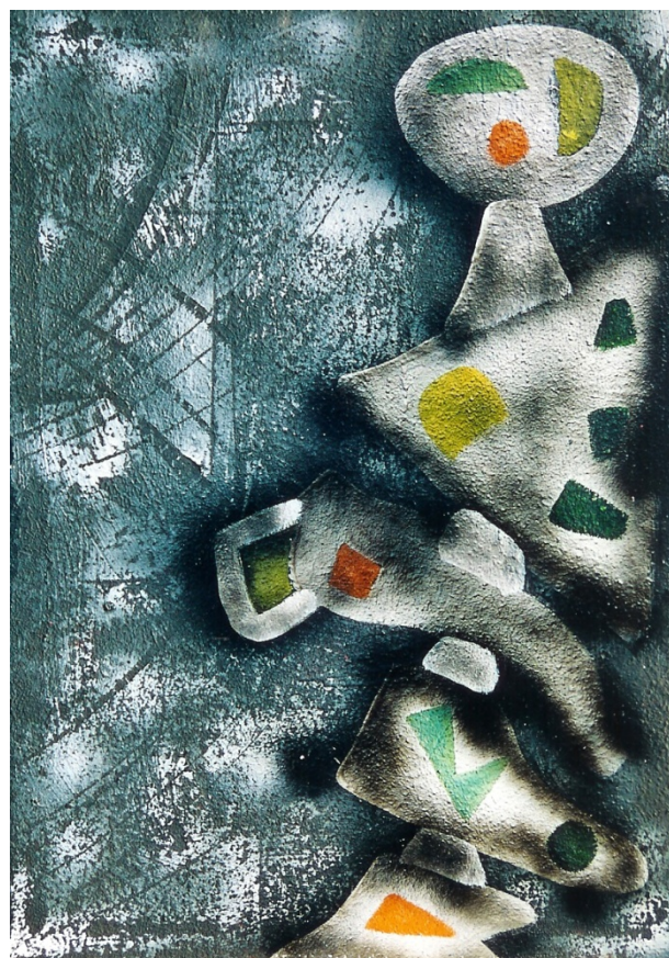
“Una notte un attore”

1987 – tecnica mista su tela - cm. 100x120